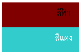
สีประจำวิทยาลัย สีฟ้า-สีแดง